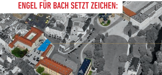
Luftbild, ehemaliger Bach-Wohnort gekennzeichnet